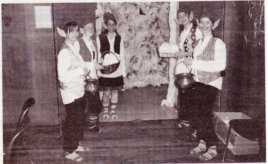
Les spectateurs étaient accueillis par des lutins.

Il était une fois une salle des fêtes métamorphosée en forêt enchantée. Le conte musical interprété par la Lyre Fraternelle a réuni de nombreux spectateurs, samedi 28 et dimanche 29 mars. Le public a découvert à son arrivée une grotte habitée de sombres insectes. Au bout de cette caverne, une troupe de lutins l'a accueilli malicieusement, en lui présentant le parchemin-programme du spectacle. Après ce parcours initiatique, l'assemblée pouvait prendre place, prête à voyager au cœur d'un monde féerique. Dans ce décor, Merlin fit son entrée et livra, pour le plaisir de tous, ses légendes tout droit sorties d'un antique grimoire. Contes et musiques s'entremêlèrent. L'union des mots et des notes composa une série d'histoires, où il était question de flotte orgueilleuse, de chevalier ambitieux, de combat du dragon, de chant de la terre... Les musiciens transformés en troubadours multiplièrent les charmes musicaux et sortilèges mélodiques pour séduire leur public.