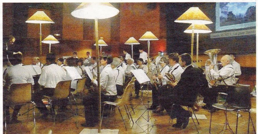
La Lyre Fraternelle a donné un concert spectaculaire.

Around the world d'Otto Schwarz inaugura ce concert. La gare St Lazare, tableau de Monet, embarqua l'assistance pour un tour du monde musical. D'un continent à l'autre, chaque sonorité incarnant un pays trouva un écho dans une toile de maître. Pomp et circonstance d'Edouard Edgar et la peinture historique anglaise, illustrant la gloire de l'empire britannique