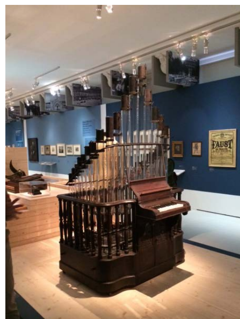
Pyrophone, inventé en 1875 par Frédéric Kastner